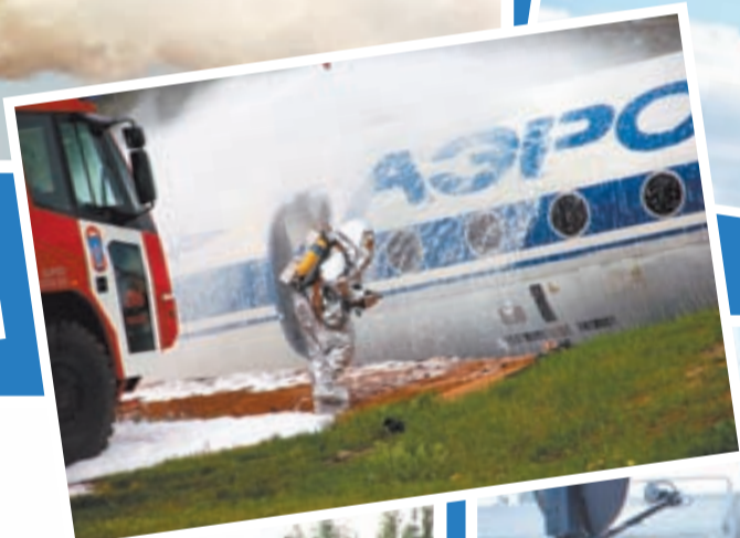
23 мая на генеральной репетиции учений побывали кадеты средней школы №4 города Железнодорожного. На полигон они прибыли в сопровождении своих шефов – сотрудников Балашихинского территориального управления «Мособлпожспас»