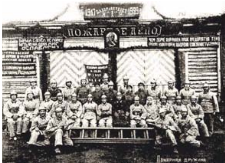
Пожарная дружина фабрики им.Ленина в п.Обухово. 1 мая, 1929 год