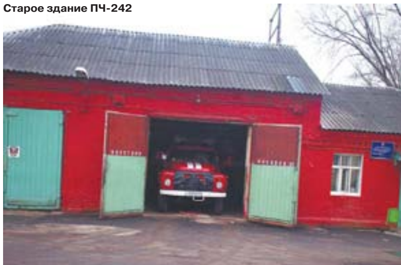
Старое здание ПЧ-242

З дание старейшей в Московской области пожарной части, расположенной в поселке Обухово Ногинского муниципального района, было построено в 1900 году, когда на территории Богородского края бурно развивалась текстильная промышленность. Пожарная часть предназначалась для защиты от пожаров Обуховской ковровой фабрики и поселка Обухово. В здании размещался пожарный обоз на конной тяге, пожарные несли службу на пожарных постах фабрики и в пожарном депо.