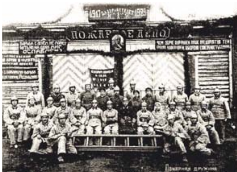
Пожарная дружина фабрики им. Ленина в п.Обухово. 1 мая, 1929 год